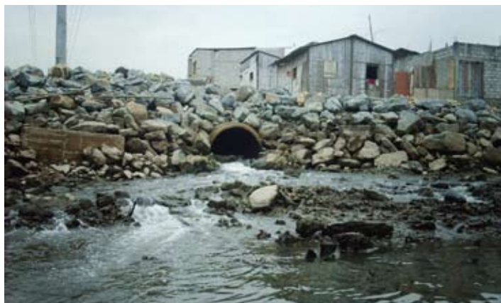
Agua sin tratar es desechada en el estuario de la isla Trinitaria.

El Observatorio Ciudadano y otras organizaciones en Guayaquil continuarán demandando que el agua y otros servicios públicos sean propios, controlados y administrados públicamente. Esta presión para el control y la participación ciudadana en los servicios públicos está siendo reconocida y respaldada a nivel internacional; por ejemplo, el reciente Informe para el Desarrollo Humano del Programa de Desarrollo de las Naciones Unidas, promueve un rol adecuado de las agencias públicas para proveer agua accesible, mostrando cómo el agua distribuida por operadores privados es más costosa, criticando de este modo las privatizaciones que a menudo son vistas como una “fórmula mágica”.