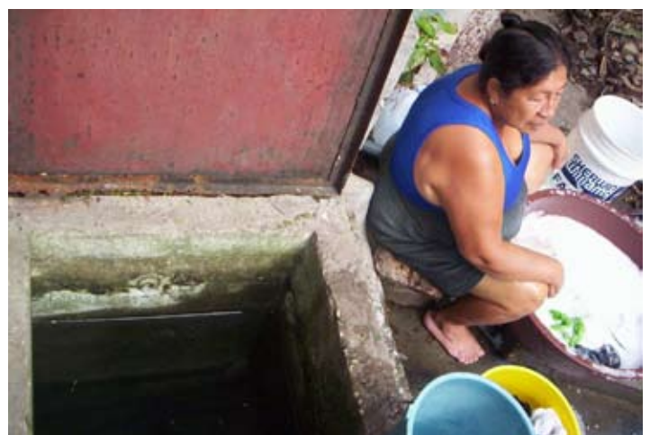
Tanque para almacenar agua en un suburbio debido a la irregularidad en el servicio.

En el 2006, los ingresos totales de Bechtel ascendían a 20.5 millones de dólares y las operaciones de Interagua en Guayaquil obtenían 300 millones de dólares. A pesar